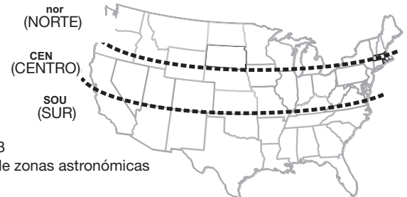
Figura 3 Mapa de zonas astronómicas